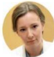
КУЗНЕЦОВА Анна Юрьевна Уполномоченный при Президенте Российской Федерации по правам ребенка.